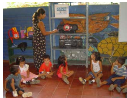
Niños y niñas del Cantón Bañadero, en el Dpto. de Cabañas, participan en una jornada con radio interactiva. Esta metodología propicia la interacción entre educadoras, niños y niñas y la radio.

Además, se visitaron todos los centros para observar el desarrollo de las jornadas. Posteriormente se hizo la sistematización y análisis de datos cualitativos y la tabulación de resultados cuantitativos.