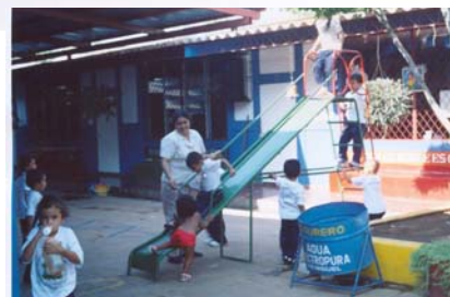
Niños y niñas de la Escuela de Educación Parvularia Profesora Graciela Flores Vda. de Grimaldi.