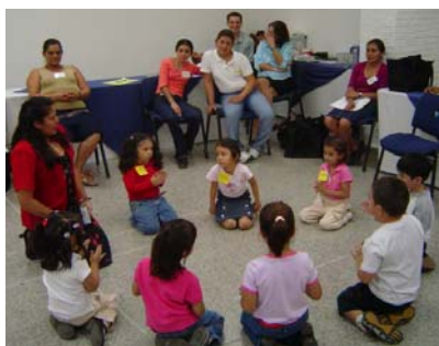
Educadoras y docentes de 8 centros de atención a la niñez fueron capacitadas por EDIFAM sobre cómo utilizar la metodología IRI en Educación Inicial y Parvularia.

Los materiales de apoyo que se usaron también se modificaron para su funcionalidad, entre ellos: dos láminas grandes a color, algunas hojas de trabajo. Estas se reprodujeron y fueron entregadas por EDIFAM a las maestras y educadoras.