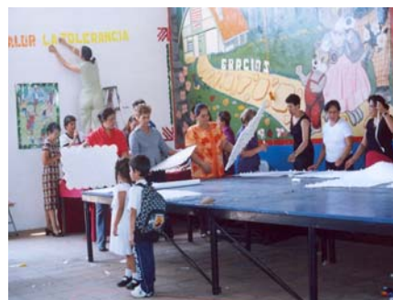
Maestras del Centro Escolar en la actividad de Escuela de Familia.

A esta institución se acercan maestras de otros centros para conocer el nuevo modelo de educación inicial y parvularia con participación de la familia.