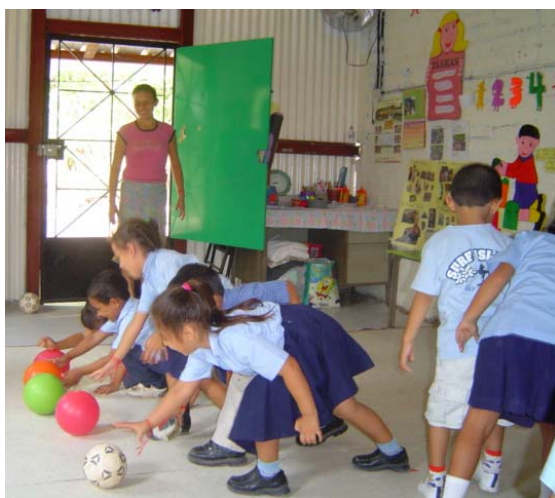
Niños y niñas participan en una jornada de radio interactiva junto con su educadora, en el Cantón La Puertona, del departamento de Cabañas.