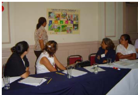
Participación de educadoras en el Congreso de Escuela de Familia en Oriente.

Se desarrollaron los congresos a nivel nacional, considerando a las tres regiones del país: occidental, central y oriental.