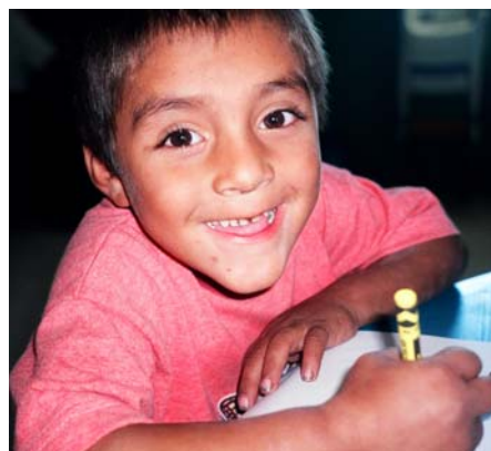
Niño del Centro de Bienestar Infantil Cantón Bañadero realizando el pretest de IRI.

Los libros fueron repartidos a ISNA, Hospital de Niños Benjamín Bloom, MINED, Centros Rurales de Salud y Nutrición del Ministerio de Salud, CBIs, Fundación la Niñez Primero, Scouts de El Salvador, Secretaría Nacional de la Familia, participantes de los congresos de familia realizados por EDIFAM, SALVANATURA, escuelas, La Casa de mi Padre, Hogar la Divina Providencia y a los niños y niñas que están siendo carnetizados en los centros de bienestar infantil del ISNA.