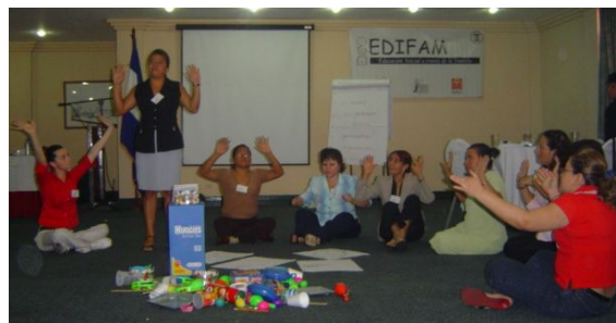
Docentes participando en el Congreso “Jugando Aprendemos.”

Como apoyo a la implementación del nuevo currículo, EDIFAM realizó en marzo y abril de este año el segundo Congreso Nacional “Jugando Aprendemos”, el cual se desarrolló con educadoras y maestras del sector formal y no formal por medio de talleres de capacitación. Estos incluían los temas de educación musical, el juego como método de aprendizaje y el teatro infantil.