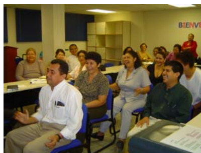
Asesores pedagógicos participando en el Taller del Manual de Capacitación en Educación Inicial y Parvularia.

Ellos recibieron asesoramiento técnico por parte del proyecto, en temáticas como: desarrollo cognitivo, del lenguaje, socioemocional, psicomotricidad y nutrición del niño y la niña menores de seis años y acompañamiento técnico en el aula, entre otros.