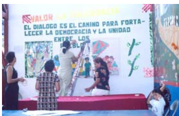
Maestras preparándose para la Escuela de Familia.

Durante las reuniones escolares, las maestras(os) trasladan estos conocimientos aprendidos a los familiares de los niños y niñas. Esto ha permitido que las familias también puedan involucrarse en el desarrollo de los pequeños y ayudarles de mejor manera en temas como disciplina alternativa, lectura emergente y destre-